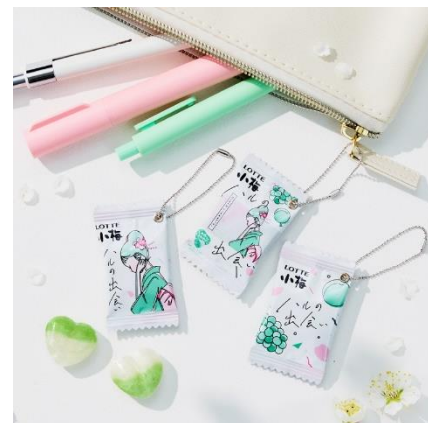
個包装を使ってミニチュアパッケージキーホルダーを作ったイメージカット

キャンディには和歌山県産南高梅果汁を使用し、これまで小梅がこだわってきたあまずつぱい梅の味わいが楽しめることはもちろん、個包装はミニチュアパッケージキーホルダーにリメイクしてもかわいいデザインにしました。「小梅の魅力はキャンディだけではない」ということ、小梅ちゃんの初恋物語を含めて、小梅の世界観をたっぷりお楽しみいただける商品にしました。